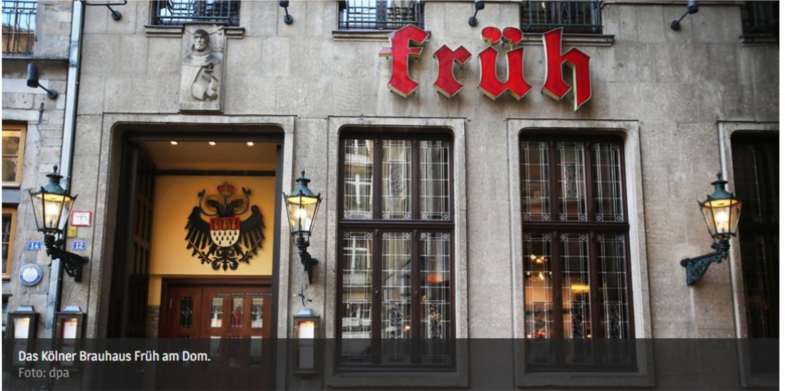
Das Kölner Brauhaus Früh am Dom.