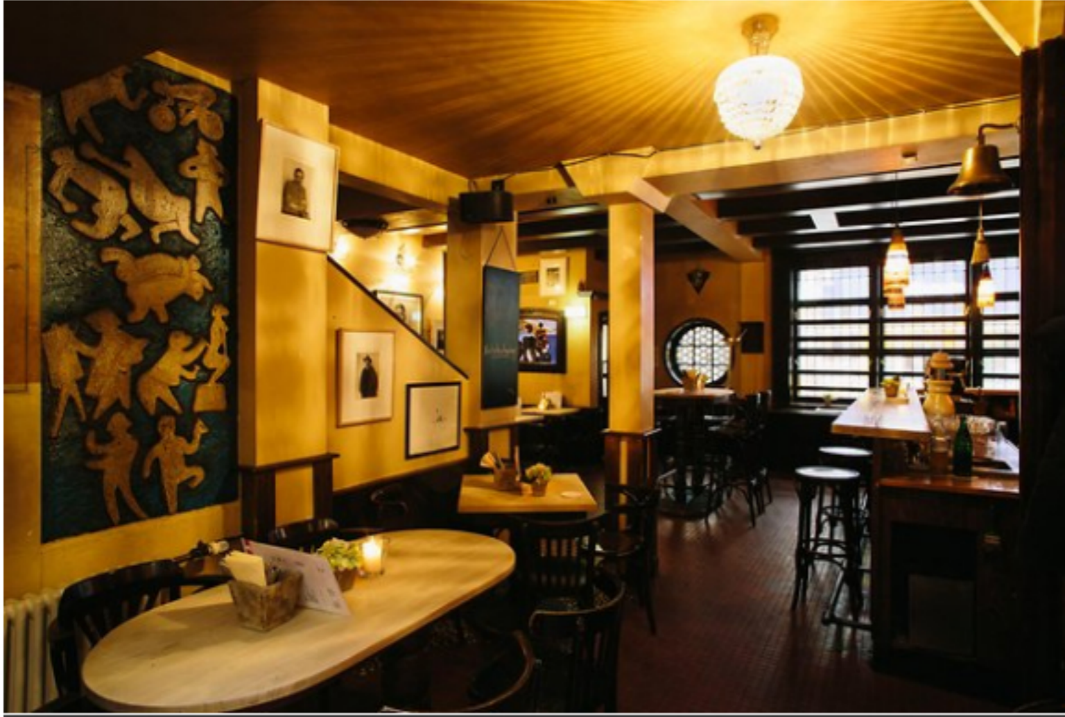
Das Kölner Brauhaus „Kleine Glocke“.

Die „Kleine Glocke“ nennt sich „Kölns älteste Künstlerkneipe“ und aufgrund der vielen Bilder und Gemälde passt das auch atmosphärisch. Eine Decke ist gar mit einer Hommage an die „Kölner Progressiven“ bemalt. Unten ist das Lokal mehr dunkel-uriges Brauhaus mit großer Theke, oben Künstler-Bistro mit großen Fenstern.